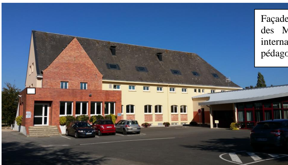
Façade avant donnant sur l'avenue des Montoires, parking aménagé, internat récent attenant au bâtiment pédagogique

Un parc clos d'1 hectare avec un espace arboré et un terrain de sport avec city-stade derrière les bâtiments