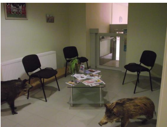
L'espace d'accueil avec élevateur pour personne à mobilité réduite qui permet d'aller de l'internat à la salle à manger