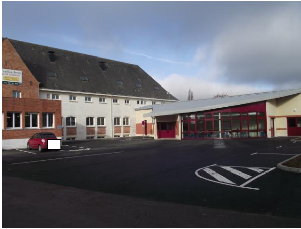
Façade avant donnant sur l'avenue des Montoires, parking aménagé, nouvel internat attenant au bâtiment pédagogique entièrement rénové