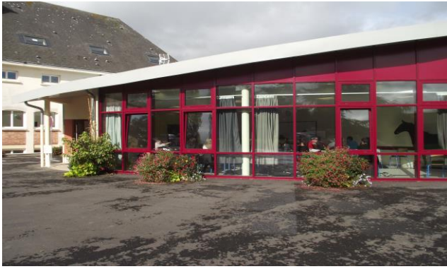
La verrière, salle de 60 m 2 , 1 évier à disposition