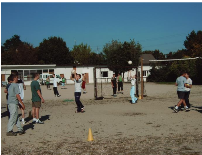
Le terrain de sport (foot, volley...)