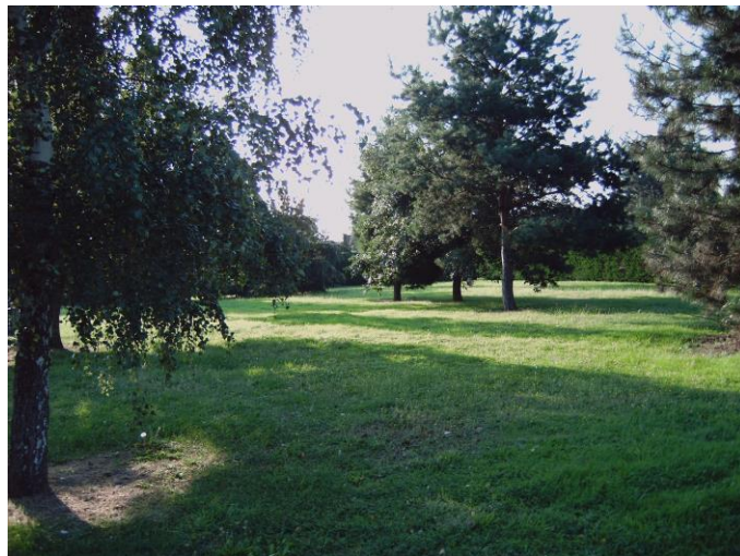
Un parc d'1 hectare avec espace arboré et terrain de sport derrière les bâtiments